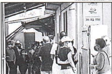
O Centro de Saúde Oswaldo Cruz, no Barro Preto, Região Centro-Sul de BH, foi um dos que registraram fila na manhã de ontem