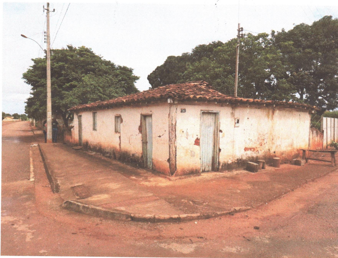
Valério Diniz Mourthé – Engenheiro Civil